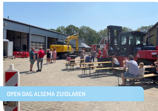
OPEN DAG ALSEMA ZUIDLAREN