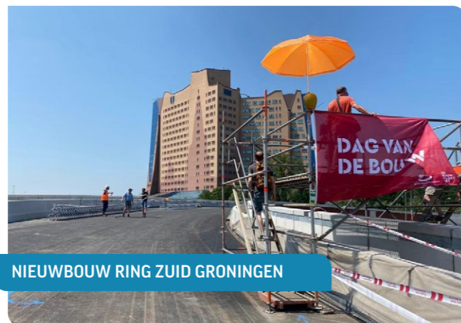
NIEUWBOUW RING ZUID GRONINGEN

Elk jaar organiseren we de Dag van de Bouw. We roepen leden op om projecten open te stellen. De afgelopen jaren ontdekten jong en oud wat er komt kijken bij het bouwen van huizen, wegen, ziekenhuizen, sluizen, dijken, stations en alle andere gebouwen en infrastructuur in Nederland. Hou zaterdag 8 juni 2024 alvast vrij en meld jouw project(en) aan op www.dagvandebouw.nl zodra de inschrijving open is. We informeren je hier over via onze nieuwsbrief. In 2023 deden 22 projecten in onze regio mee aan de Dag van de Bouw. Onderstaand lichten we er vier uit: