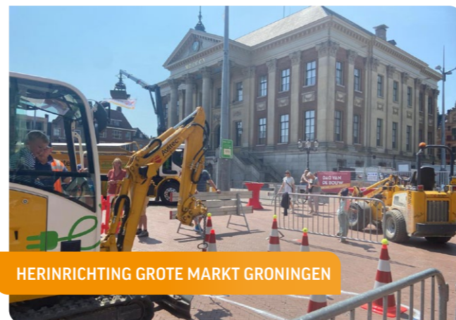
HERINRICHTING GROTE MARKT GRONINGEN