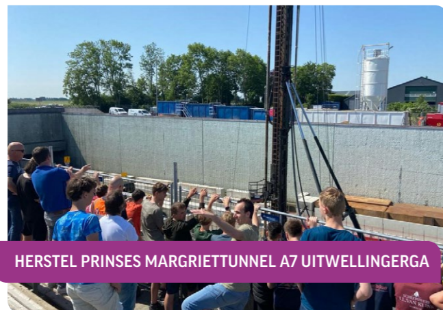
HERSTEL PRINSES MARGRIETTUNNEL A7 UITWELLINGERGA