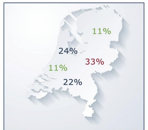
Aantal lidbedrijven per vakgroep