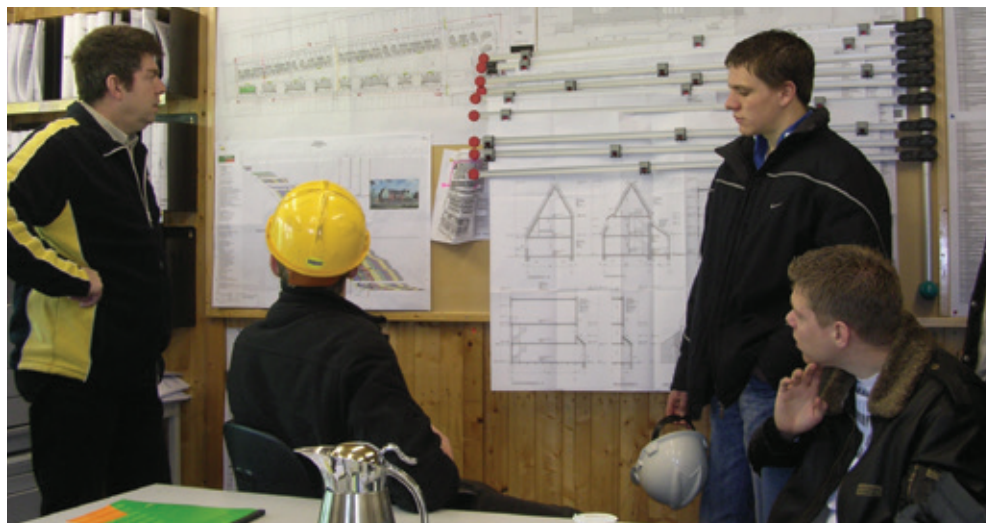
Studenten van INHolland tijdens een stagebezoek aan een bouwbedrijf.