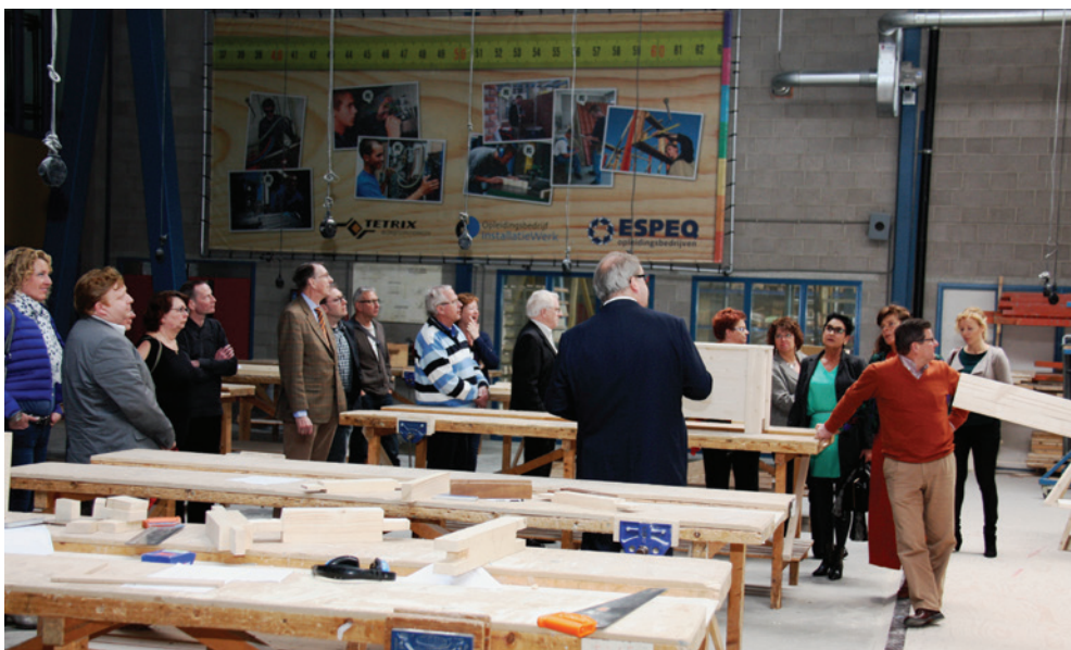
De raadsleden krijgen een rondleiding bij ESPEQ.