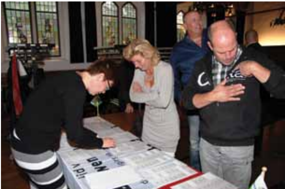
De genodigden arriveren in de Grote Kerk in Alkmaar.

Maxime Verhagen drukte de bouwers op het hart in te spelen op de gewijzigde samenstelling van de bevolking en de daarmee samenhangende gewijzigde vraag. Hij beloofde ondertussen aan de poort in Den Haag te blijven rammelen om stimuleringsmaatregelen los