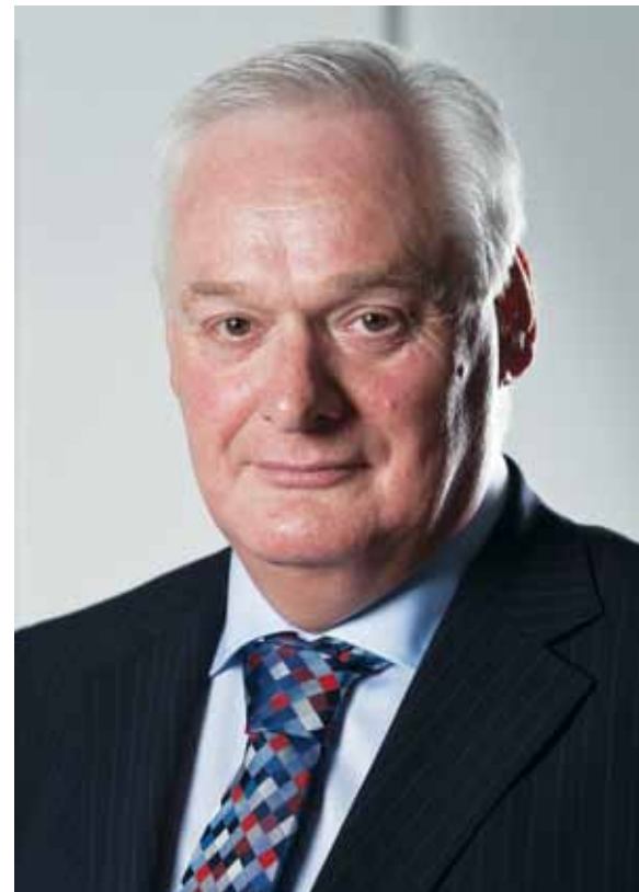
“We hebben vaak dezelfde belangen als de bouwers: er moeten woningen komen”

“Absoluut. Kijk naar het Pakhuizen-project. Jarenlang zat het muurvast, nu staan de inwoners in de rij om er een huis te kopen. Dat is niet alleen mooi om te zien, het is meteen ook een goed signaal naar de bouwsector: het kan dus wél in deze tijd.”