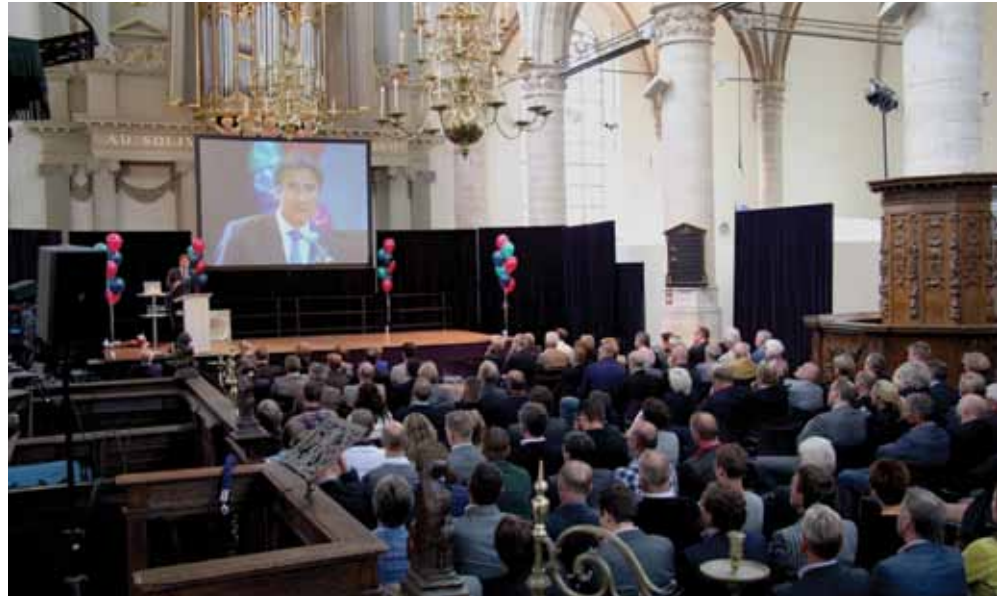
De goedgevulde kerk luistert aandachtig naar de toespraak van Maxime Verhagen.