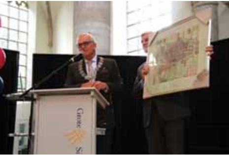
Het cadeau van de stad Alkmaar aan Bouwend Nederland afdeling Alkmaar: een replica van een stadskaart van Joan Blaeu uit 1649.