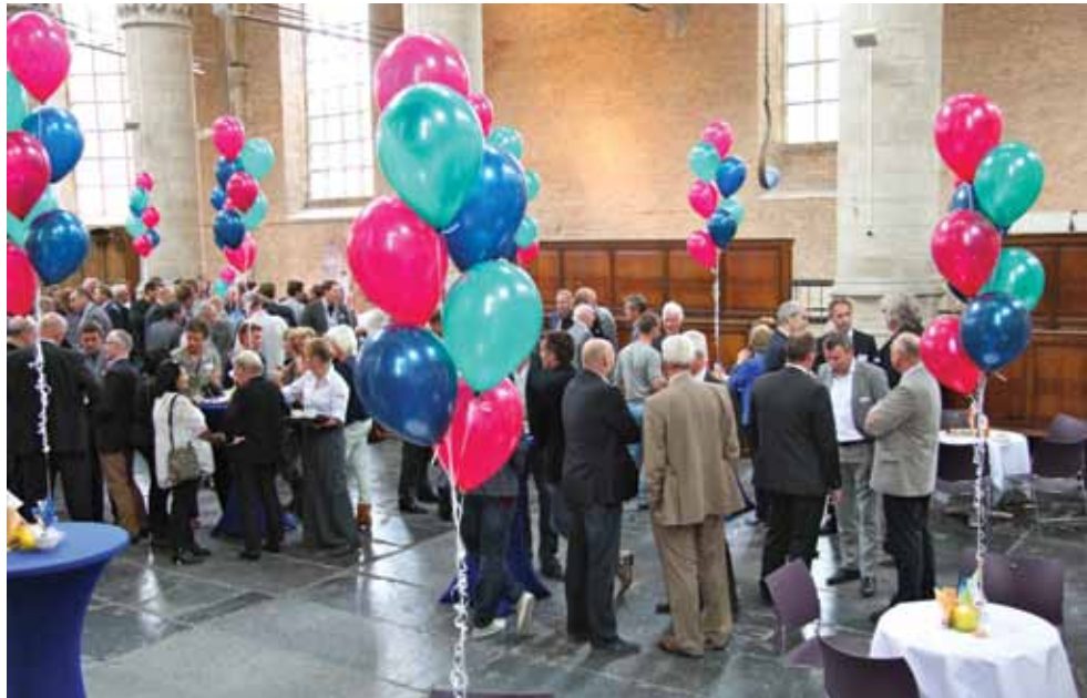
De kerk stroomt langzaam maar zeker vol.