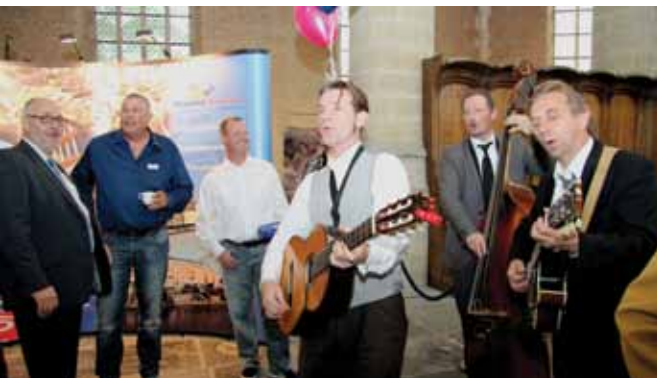
Muzikaal vermaak na het officiële gedeelte.