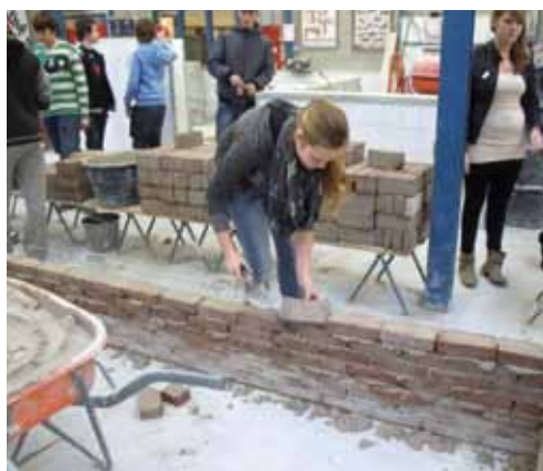
Meisjes hebben 'metsello'.