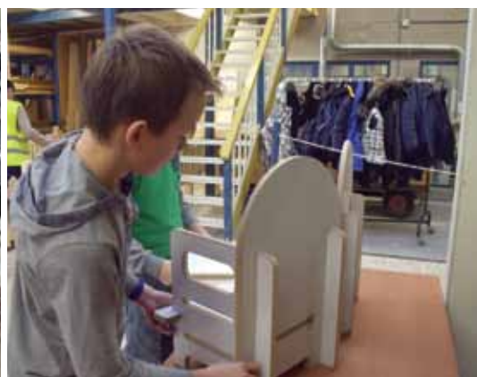
Dagelijks steken tientallen tot honderden leerlingen de handen uit de mouwen.