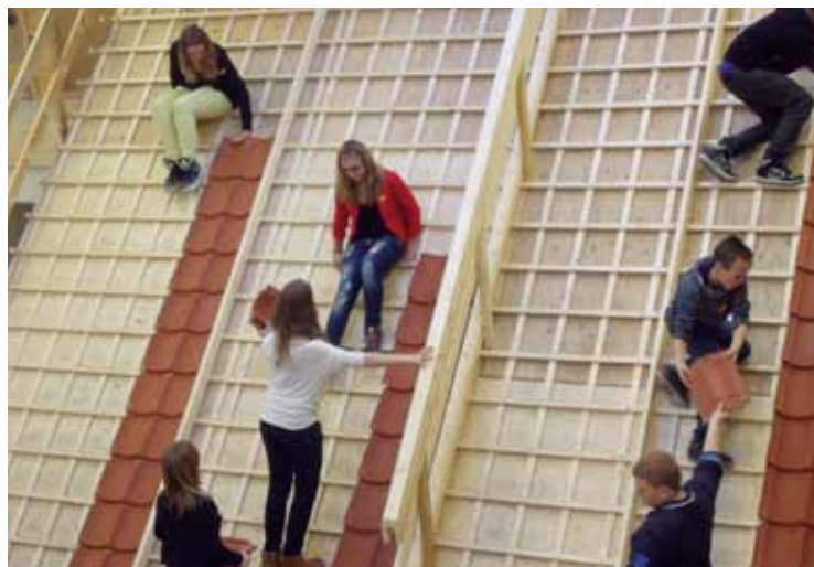
Binnen een tijdsbestek van 2 uur voeren ze tien verschillende (technische) opdrachten uit die de dagelijks bouwpraktijk zo dicht mogelijk benaderen.

Meer dan 2.300 tweedejaars vmbo-leerlingen afkomstig van ruim 20 scholen uit Noord-Holland Noord maakten tussen 26 november en 7 december nader kennis met de bouw. Via boeiende vakdemonstraties en aantrekkelijke doeactiviteiten ontdekten ze wat de bouw hen allemaal te bieden heeft.