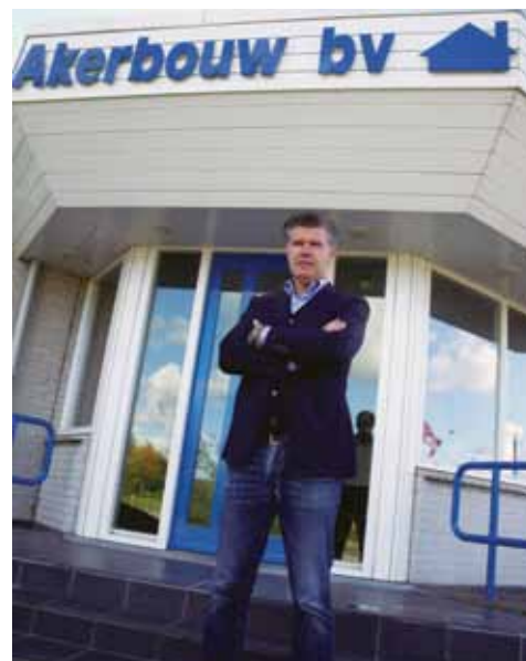
“Het verbaast me wel eens dat wij het nog zo goed doen.”

Voor de buitenwereld springen de restauratieprojecten van Akerbouw het meest in het oog. De specialisten van het Uitgeester bedrijf brachten onlangs het voormalig gemeentehuis van Castricum compleet terug in de oude stijl. Het bedrijf maakte ook het ontwerp voor dit pand dat sinds kort in gebruik is als ‘Bed & Breakfast’. Eind 2012 werd bovendien het landelijk bekende ‘schooltje van Dik Trom’ in Etersheim opgeleverd. Akerbouw renoveerde dit authentieke 19e eeuwse schoolgebouwtje, waar onderwijzer C. Joh. Kieviet in 1891 zijn eerste boek over Dik Trom schreef.