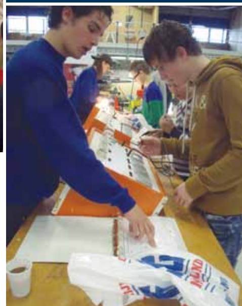
Bij een hal van SPG Regio Noord-Holland Noord doen de kinderen technische opdrachten.

Dankzij het evenement kunnen de tweedejaars vmbo-leerlingen beter geïnformeerd een beroepskeuze doen.