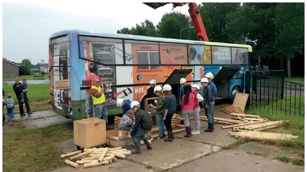
De ESPEQ-techniekbuss doet ook dit jaar diverse timmerdorpen aan.

Daarnaast sponsort ESPEQ de timmerdorpen met een techniekbrochure voor ieder kind. In de brochure staat een prijsvraag en onder alle goede inzendingen worden twee drones verloot. Wij zijn blij met ESPEQ en Bouwcenter Rab en natuurlijk met de vrijwilligers die het Bouwend Nederland mogelijk maken een fantastische Actie Timmerdorpen te organiseren.