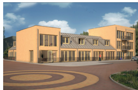
Heiloo, appartementen met winkelruimte