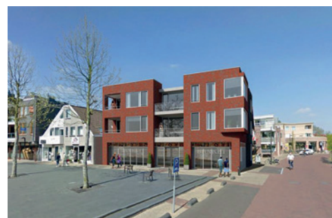
De Rijp, starterswoningen