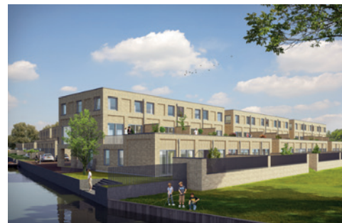
Heerhugowaard, 69 woningen

Hoewel de bouw in ons land het dieptepunt van de crisis achter de rug heeft, is het niveau van voor de crisis nog niet bereikt. Begin dit jaar lag de bouwproductie nog meer dan 10 procent onder het niveau van begin 2008.