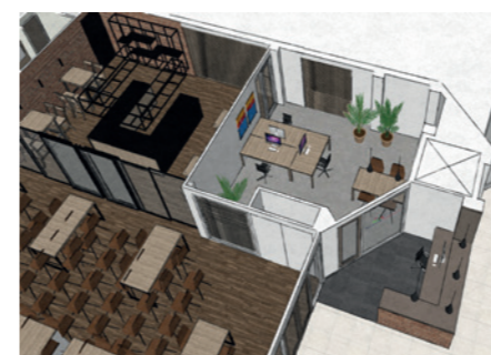
Het nieuwe onderkomen van Bouwend Nederland in wording, met links de sociëteit en bar, midden boven de kantoorruimte en rechts de entreeruimte. (artist impression RAAD Architecten)

Leerlingen, aannemers, medewerkers van ESPEQ en vele anderen zijn dag en nacht in de weer om de begane grond zo snel mogelijk gereed te maken. Op bijgaande 'artist impression' is zichtbaar hoe het straks wordt. Het streven is dat de sociëteit in oktober 2018 gereed is. Begin november wordt de entree betegeld en vanaf dat moment is de begane grond klaar voor gebruik.