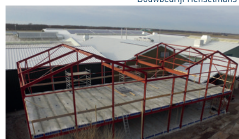
Aannemersbedrijf Fa. P.N. Dekker en Zns