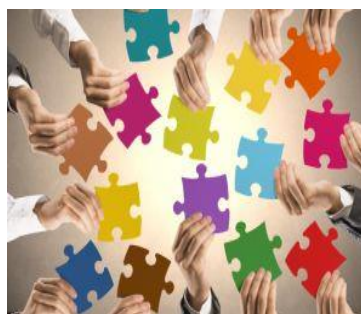
Oog voor de opgave