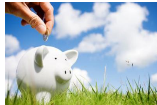
Waar voor je geld