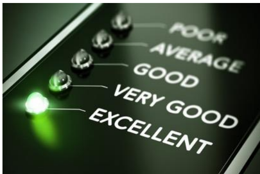
Op naar een topsector