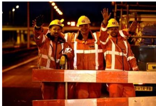
Trots op het werk