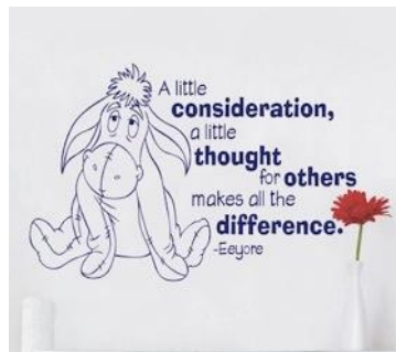
Rekening houden met elkaar