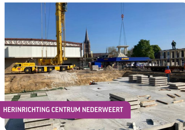
HERINRICHTING CENTRUM NEDERWEERT