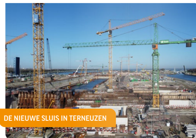
DE NIEUWE SLUIS IN TERNEUZEN