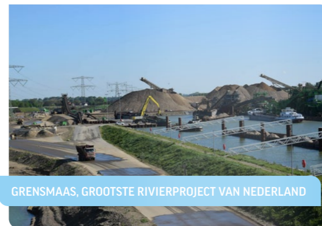
GRENSMAAS, GROOTSTE RIVIERPROJECT VAN NEDERLAND